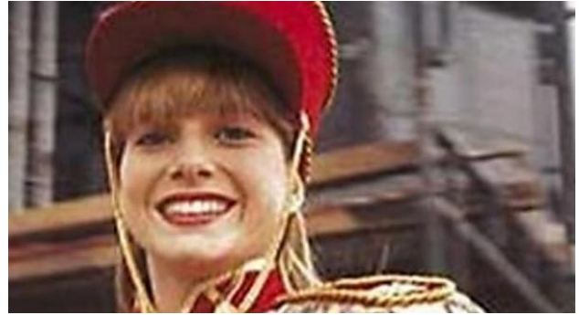
[Fotos] Você se lembra das Paquitas da Xuxa? Veja como estão hoje! desafiomundial