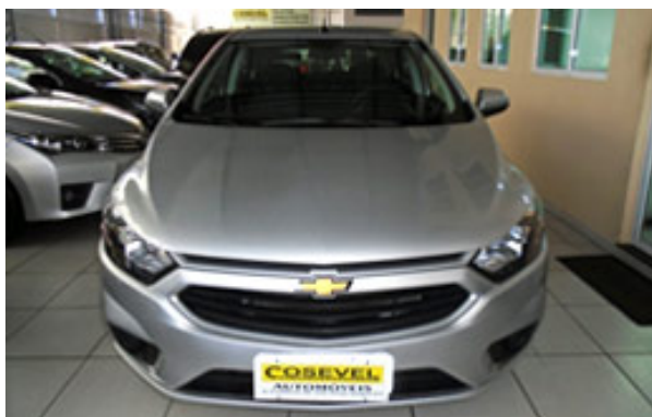
Chevrolet Onix Flex 1.4 5 portas Manual