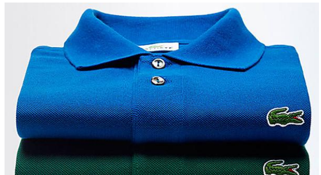
Kit 3 Polos Lacoste Por R$99,90 Chiq Brands