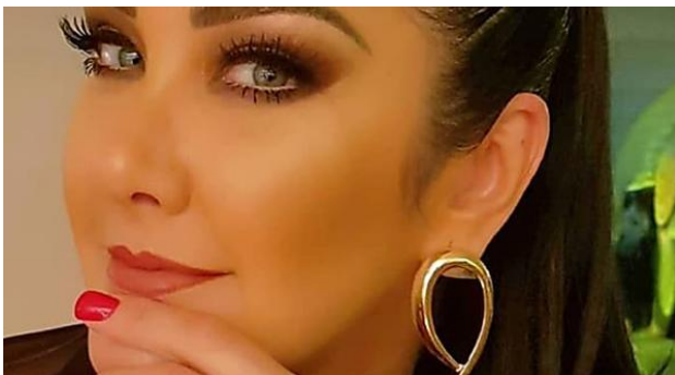
Atriz do SBT descobre fórmula para emagrecer rápido e vira febre no Brasil noticia-hoje.com