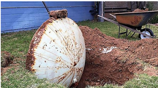
[Fotos] Homem compra casa nova, e o seu instinto lhe diz para cavar um buraco no quintal desafiomundial