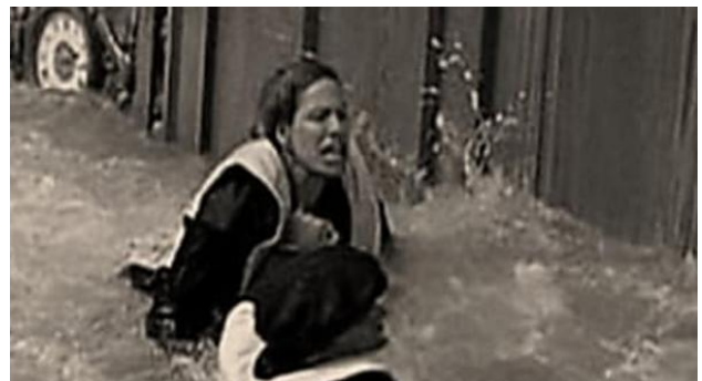
Fotos Horrripilantes do Titanic Encontradas em Câmera Antiga Coolimba